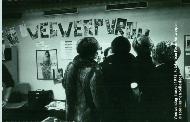
Vrouwendag Brussel 1972.