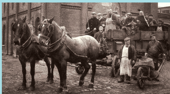
Arbeidstherapie, 1886, foto, Museum Dr. Guislain Gent

De eerste voorwaarde is een menswaardige aanpak! 'Geen vraagzucht of onnoodige strengheid, geen bespottling. Geweld, neen, tenzij in geval van dringende noodt en altijd zonder slagen of stooten. Onophoudelijk aanwakkeren tot bezigheden, arbeid, lichaamsbeweging, wandelen, dansen, lezen, schilderen, muziek beluisteren, kaartspelen...'