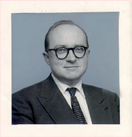
De Leo zag er in zijn jeugd duidelijk minder filosofisch uit...

Antwerpenaar Leo Apostel stapt op het einde van WO II de Brusselse universiteit binnen om er filosofie te studeren. De ULB dus. Van een Vlaamse universiteit is in onze hoofdstad nog geen sprake. Apostel raakt snel in de ban van grote denkers en die wil hij na zijn studies van naderbij leren kennen. Naar Chicago dan maar. Om te luisteren naar Rudolph Carnap. Wat later naar Genève. Om aan de lippen te hangen van Jean Piaget.